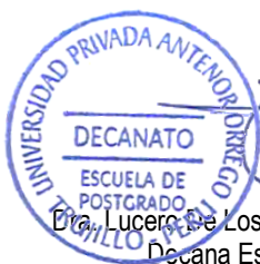
Dra. Lucero De Los Remedios Uceda Dávila Decana Escuela Posgrado